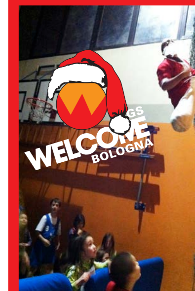
Arriva Babbo Natale dalla parete di arrampicata!!!!