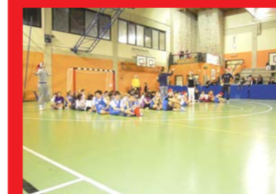
Spiegazioni prima di partire